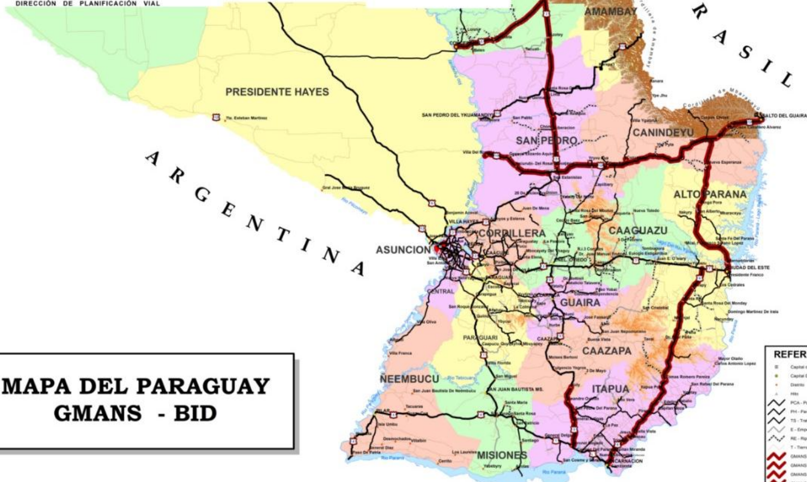
MAPA DEL PARAGUAY GMANS - BID

GABINETE DEL VICEMINISTERIO DE OBRAS PÚBLICAS Y COMUNICACIONES DIRECCIÓN DE PLANIFICACIÓN VIAL